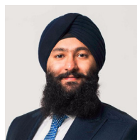
Prabmeet Singh Sarkaria, ministre associé délégué aux Petites Entreprises et à la Réduction des formalités administratives