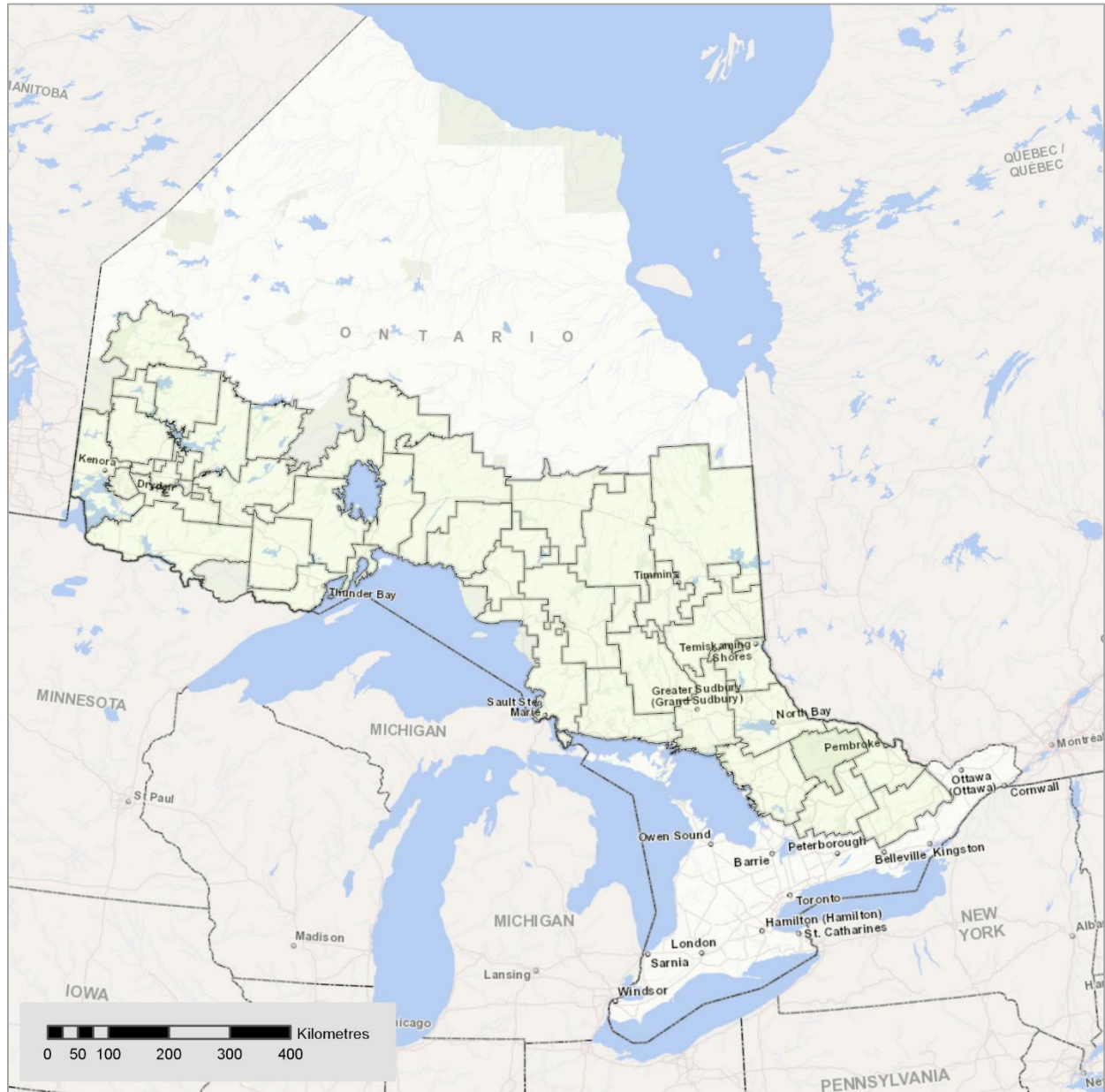
Figure 1 : Unités de gestion en Ontario en 2021