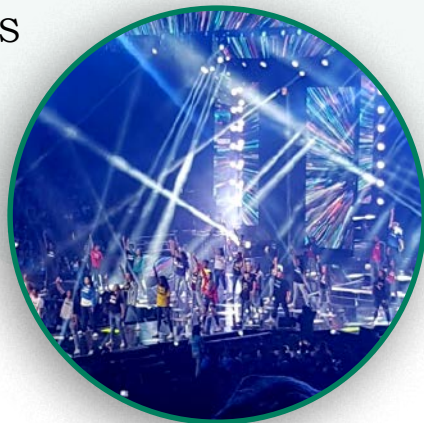
Photo de la scène de spectacle de la journée UNIS à Toronto.

La journée UNIS est une présentation inspirante sur scène qui comprend des conférenciers de renommée mondiale et des artistes primés. Les activités de la journée UNIS organisées à Toronto en septembre et à Ottawa en novembre ont accueilli 36 000 étudiants et enseignants motivés dans l'espoir de favoriser des changements positifs dans leur collectivité. Les deux présentations comprenaient un segment de sensibilisation à l'accessibilité sur scène.