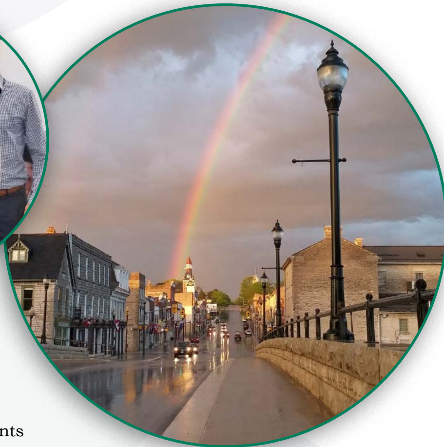
Photo de St. Marys à la suite du projet de revitalisation du centre-ville, qui comprenait la rénovation du pont pour en assurer son caractère accessible. La partie du trottoir qui touche à la chaussée est d'une couleur légèrement plus claire que le reste du trottoir. Cette partie a été ajoutée afin d'élargir le trottoir pour que sa largeur respecte les normes d'accessibilité.