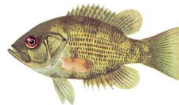
Crapet de roche