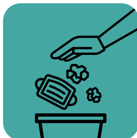
提供安全丟棄擦拭巾、口罩和手套的容器