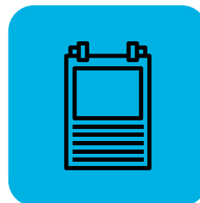
張貼安全規定供員工查看