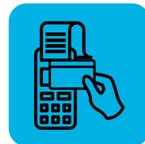
儘量減少與顧客直接接觸