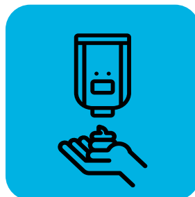
為送貨員和顧客提供消毒洗手液