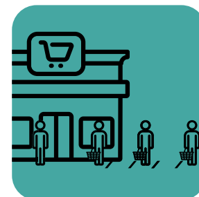
指定專人負責保持社交距離