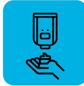
Maglaan ng hand sanitizer para sa mga taong nagdedeliver at mga customer