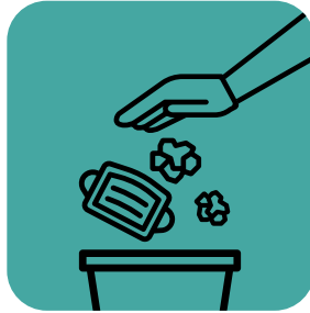
Maglagay ng ligtas na pagtatapunan ng mga wipes, pantakip sa bibig at ilong, at gwantes