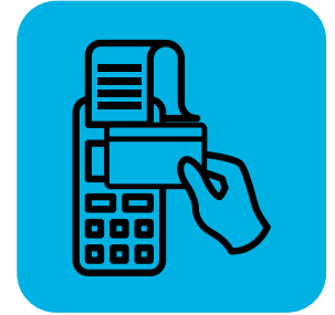
Limitahan ang pakikipag-ugnayan sa mga customer