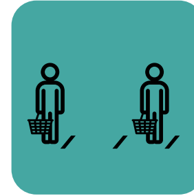
Limitahan ang dami ng mga customer