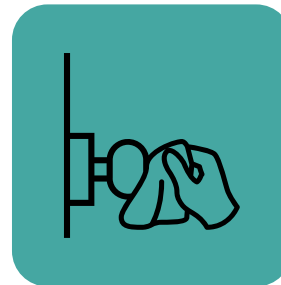
ਵਾਰ-ਵਾਰ ਹੱਥ ਲੱਗਣ ਵਾਲੀਆਂ ਸਤ੍ਹਾਵਾਂ ਨੂੰ ਸਾਫ਼ ਕਰੋ