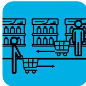
ਗਾਹਕਾਂ ਵਿਚਾਲੇ ਦੂਰੀ ਯਕੀਨੀ ਬਣਾਉਣ ਲਈ ਜ਼ਮੀਨ 'ਤੇ ਨਿਸ਼ਾਨ ਲਗਾਓ