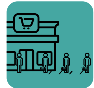
ਦੂਰੀ ਕਾਇਮ ਰੱਖਣ ਦੀ ਡਿਊਟੀ ਸਟਾਫ਼ ਨੂੰ ਦਿਓ