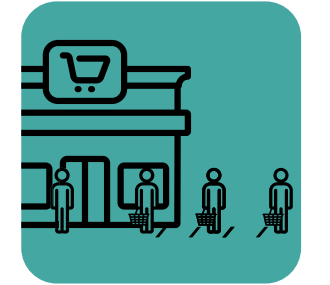
અંતર જાળવવા સ્ટાફની સોંપણી કરો