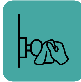
વારંવાર સ્પર્શ થતી સપાટીઓને સાફ કરો