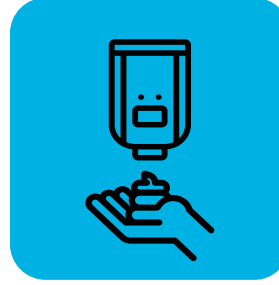
વિતરણ કરનારા લોકો અને ગ્રાહકો માટે હેન્ડ સેનિટાઇઝર પૂરું પાડો