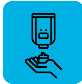
عرضه کردن ضد عفونی‌کننده دست برای تحویل‌دهنده‌ها و مشتریان