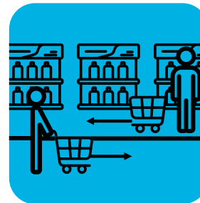
علامت‌گذاری زمین برای رعایت فاصله بین مشتریان