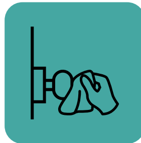
تمیز کردن سطوحی که مرتباً لمس می‌شوند