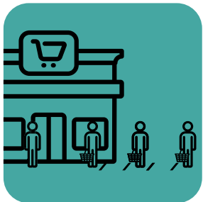
محول کردن مسئولیت رعایت فاصله بر عهده چند نفر از کارمندان