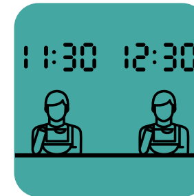
تنظیم زمان نهار به‌طور متناوب