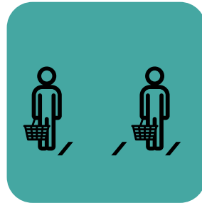
محدود کردن تعداد مشتریان