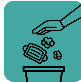
ایجاد مکانی ایمن برای دور انداختن دستمال‌ها، ماسک‌ها و دستکش‌ها